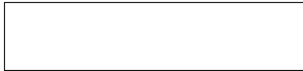
Şekil 1. Şekil alt yazısı (10 punto).