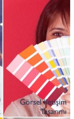
Görsel İletişim Tasarımı