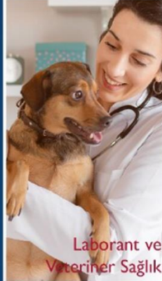
Laborant ve Veteriner Sağlık