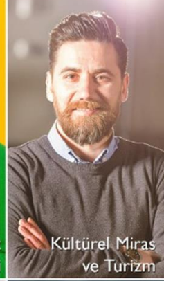
Kültürel Miras ve Turizm