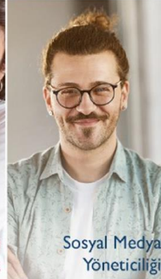
Sosyal Medya Yöneticiliği