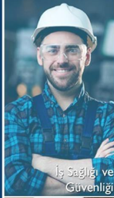
İş Sağlığı ve Güvenliği