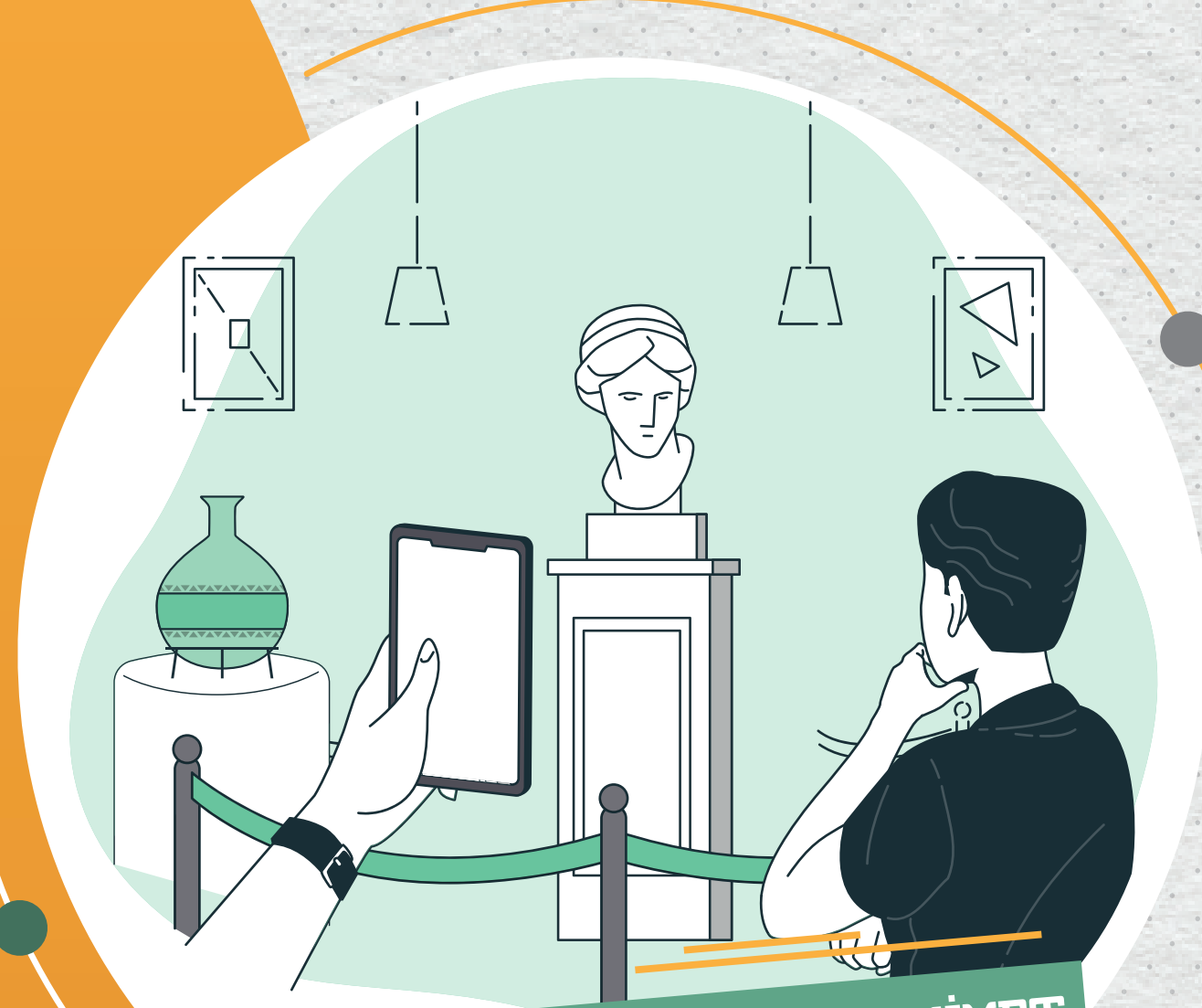
TARİH KÜLTÜR VE MEDENİYET KAMPLARI